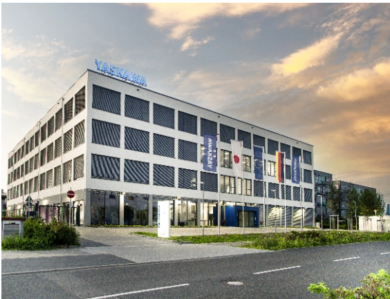
YASKAWA Europe GmbH